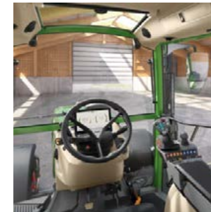
Profi Setting 1