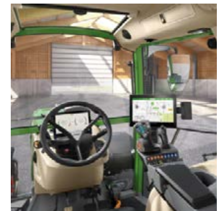
Profi+ Setting 2