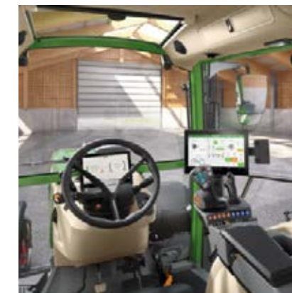
Profi Setting 2