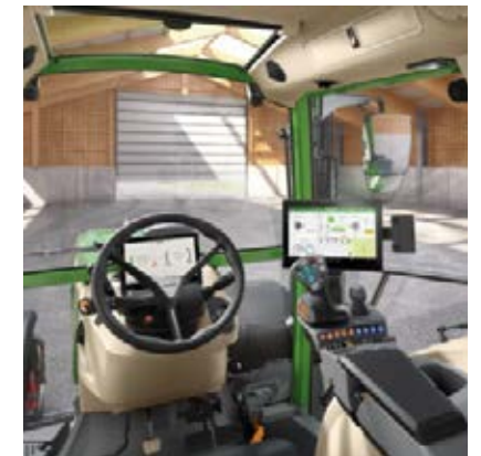
Profi+ Setting 1